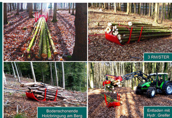
Bodenschonende Holzbringung am Berg

Eine innovative Produkt-Entwicklung der BOEHLER – SYSTEMS GmbH